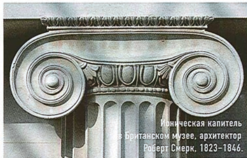
Ионическая капитель Британском музее, архитектор Роберт Смерк, 1823-1846.