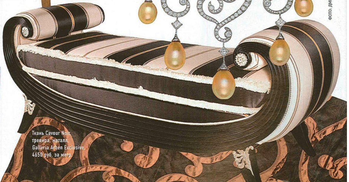
Ткань Savour Noir, тревира, металл, Galleria Argem Exclusive, 4650 руб. за метр.