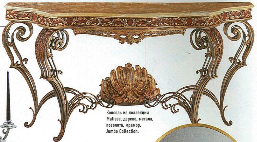
Консоль из коллекции Matisse, дерево, металл, позолота, мрамор, Jumbo Collection.